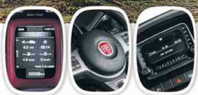
COMPUTADOR A BORDO * COMANDOS AL VOLANTE * RADIO CONNECT CON USB, AUXILIAR Y MANOS LIBRES