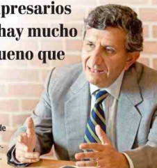
El gerente general de CCU recibirá el premio Ingeniero Comercial Distinguido 2015.