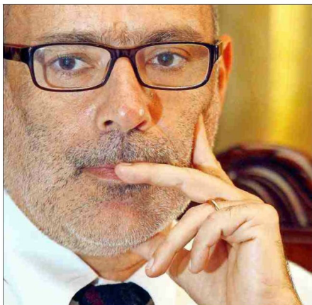
Durante 2016, Hacienda reactivará la agenda de Modernización del Estado, que incluye los proyectos de ADP, gobierno corporativo de Enap, reforma a la SVS y la nueva Ley de Bancos.

“ Lo que a mí me deja tranquilo es tener una reforma tributaria que funcione, que recaude lo que debe recaudar, que tiene incentivos correctos y que hace que paguen los que deben pagar, según se diseñó. Una cosa que quedó clara incluso en todas las intervenciones de los invitados a la Cámara, es que todos dije-