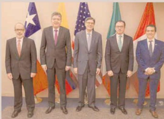
El ministro Valdés junto a los titulares de Hacienda de Colombia, EEUU, México y Perú la semana pasada en Washington, en el marco de las reuniones del FMI y el BM.

"Creemos que la exportación de servicios puede ser un foco importante de crecimiento no sólo para Chile, sino también para la región. Hay coincidencia en que en un mundo de bajos precios de commodities y monedas regionales más depreciadas, las exportaciones de servicios pueden jugar un papel muy importante en expandir el sector externo y dinamizar la economía. Hay mucho trabajo que hacer, tanto