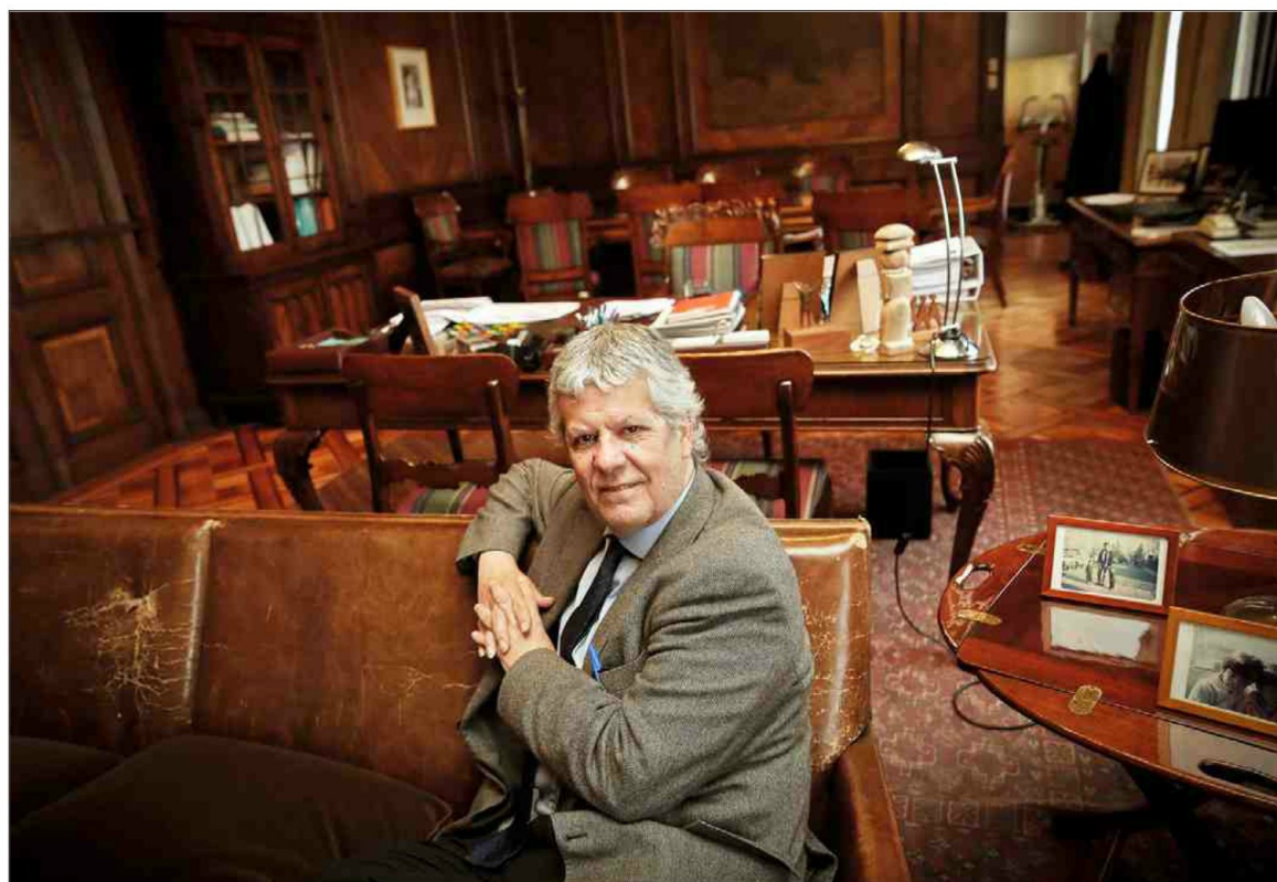
"El cobre nos va a dar más ingresos", dice el titular de Hacienda.

-¿Estamos entrando en un ciclo económico positivo? ¿Qué va a ha-